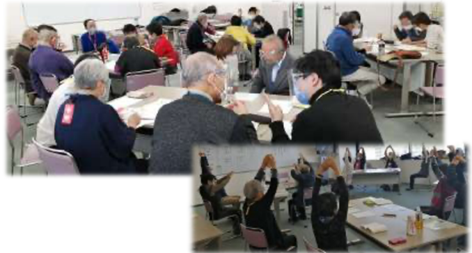
交流会の様子－感染対策をしています－

失語症のリハビリは 外出し、人と会って、話すこと 退院したら「あすの会」にどうぞ！ 一緒に笑うと、言葉も出てきます 見学も大歓迎です